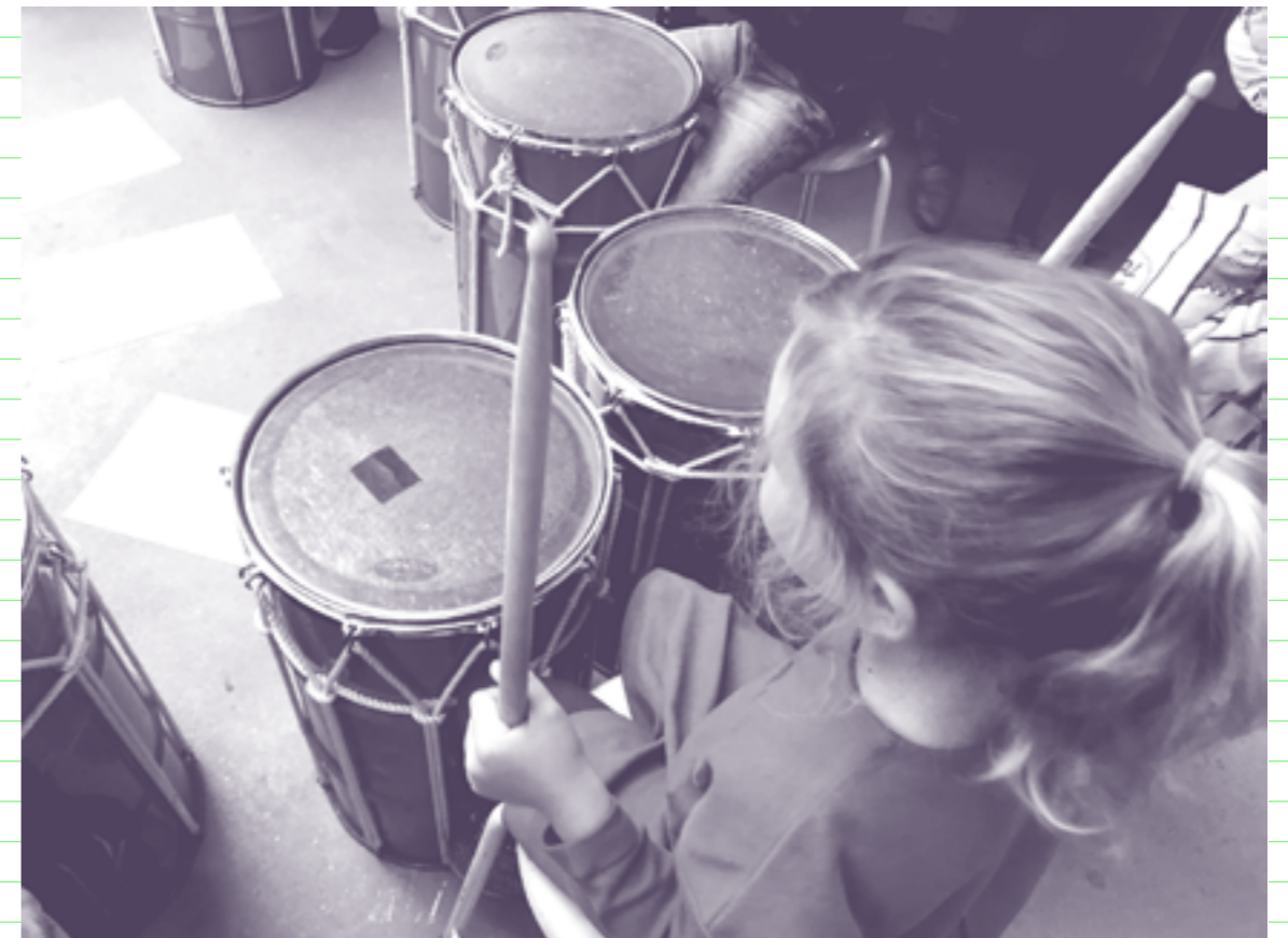
Talentontwikkeling in het atelier