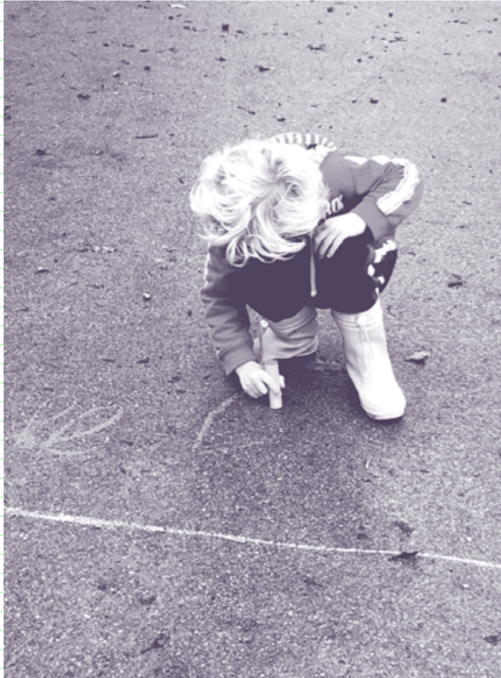
Breinvriendelijk leren schrijven