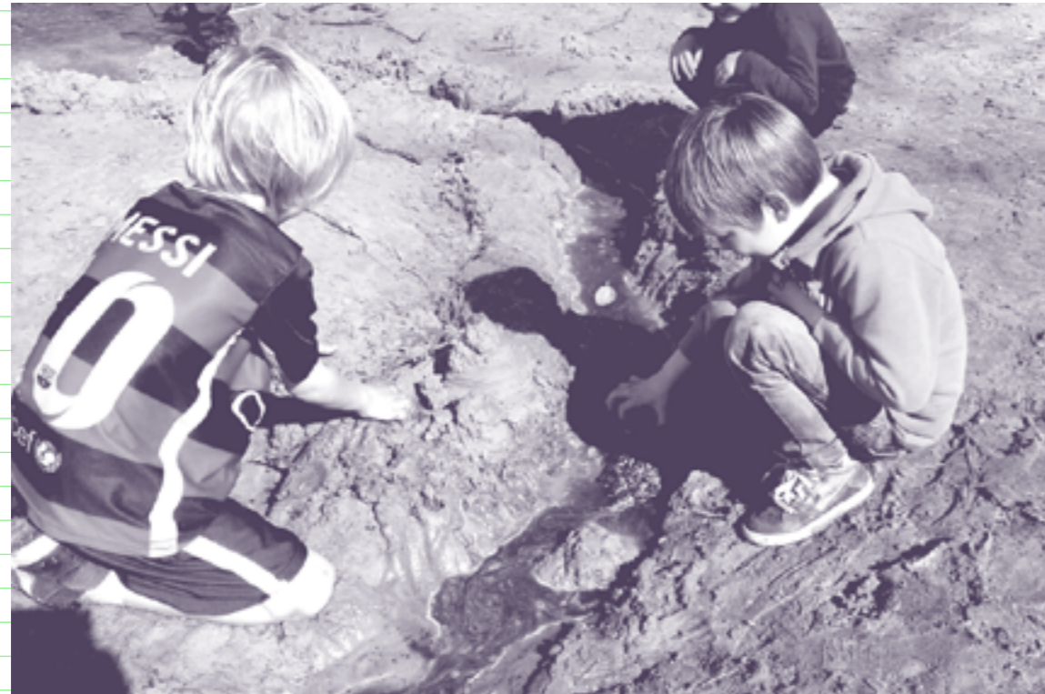
Samen spelen en leren in de natuur